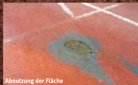
Abnutzung der Fläche

Kunststoffreinigung Reinigung verschmutzter Flächen Kunststoffreparatur Erneuerung stark beanspruchter Teilbereiche im Belag