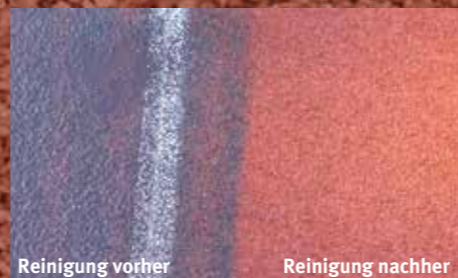
Reinigung vorher Reinigung nachher