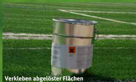
Verkleben abgelöster Flächen