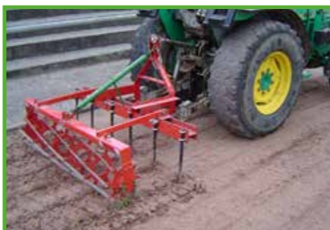
Bild 2: Schneiden von unerwünschtem Aufwuchs