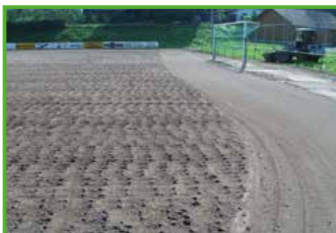
Bild 5: „Verzahren“ der Deckschicht mit der dynam. Schicht

durchgetretenen Löchern, wenn schon die dynamische Schicht in Mitleidenschaft gezogen wurde, muss zuerst diese Schicht profilgerecht hergerichtet werden, bevor das Ersatzmaterial für den Belag eingebaut wird.